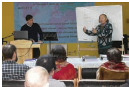
Обсуждение рецензий бурятских церквей